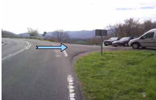
Kortakogain (GI-3591 errepidea)

Vamos a estrenar un recorrido nuevo, cerca del conocido Arantzazu. Para llegar hay que tomar la carretera que va desde Oñati a Arantzazu (GI3591) , y desviarse a la derecha en el lugar conocido como Kortakogain (coordenadas: 42.994812,-2.421566), y seguir hasta que se termine la carretera de cemento. Quedaría todavía 1 km de carretera sin pavimentar. Para que nadie se pierda en el camino, pondremos algunos carteles. Hay que tener en cuenta que es una carretera estrecha que va a caserios, por lo que hay que moderar la velocidad.